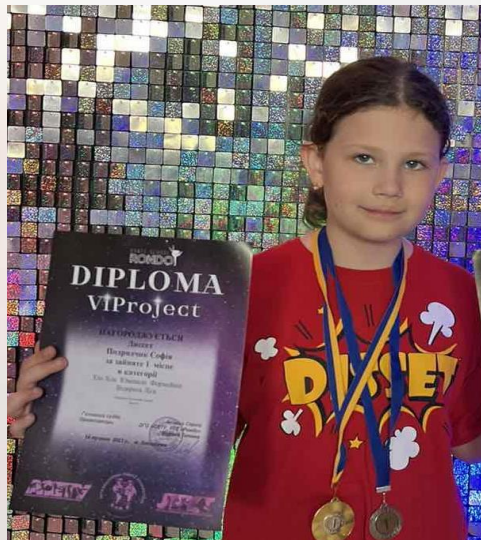
Подрядчик Софія – I місце хіп-хоп!